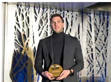
Γ. Φουντούλης, Αρχηγός Εθνικής Ομάδας Υδατοσφαίρισης