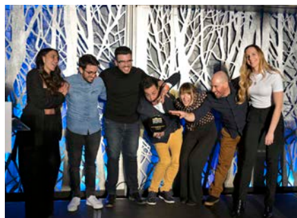
The Magic Bus