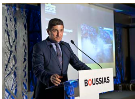
Λ. Αυγενάκης, Υφυπουργός Πολιτισμού και Αθλητισμού