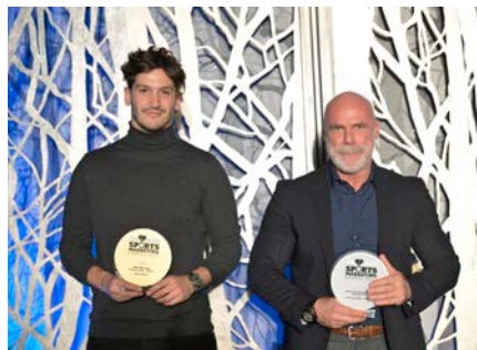
ΠΑΕ ΟΦΗ 1925